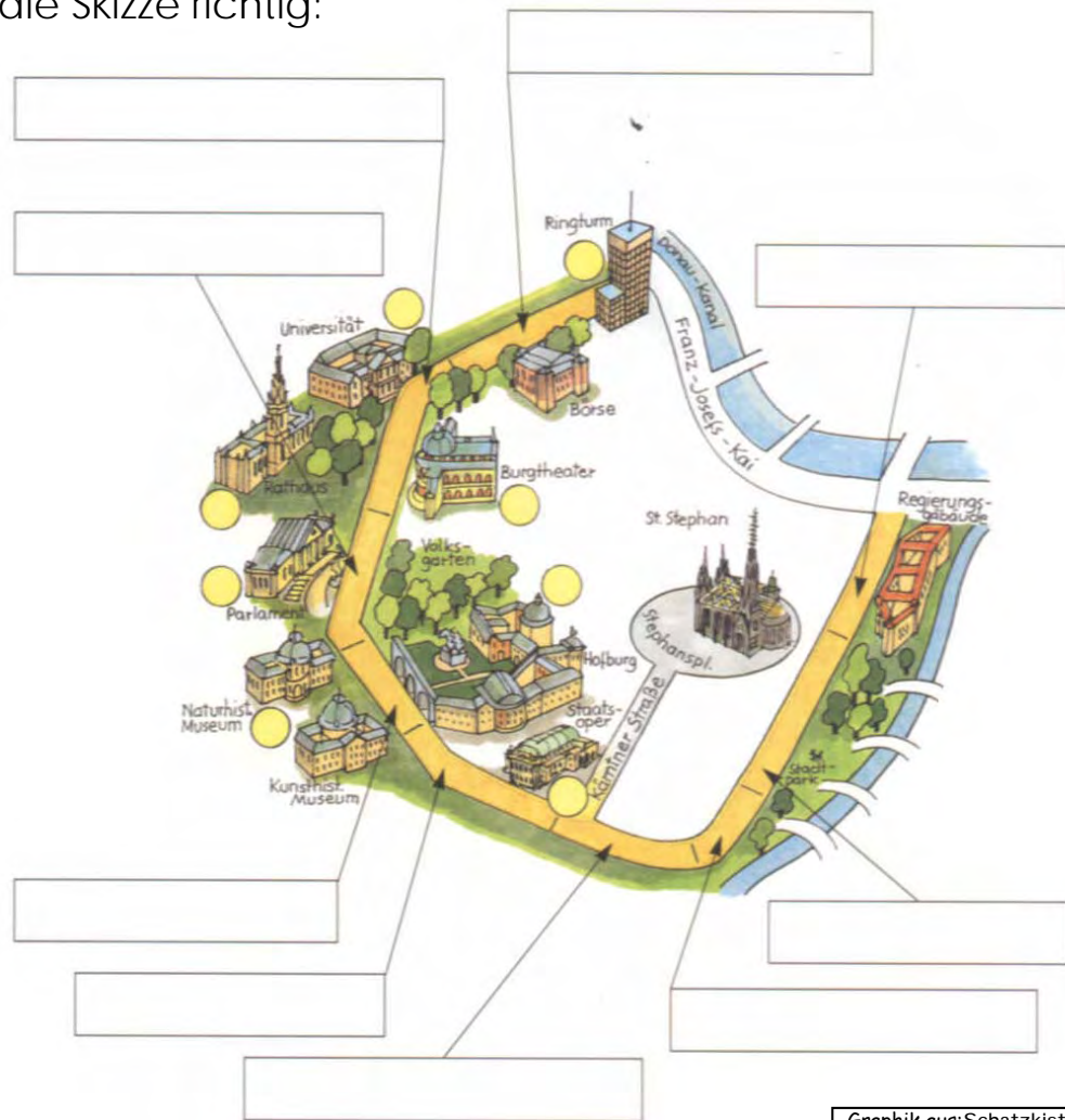
Graphik aus: Schatzkiste Wien Länderteil © Verlag E. DORNER GmbH, Wien