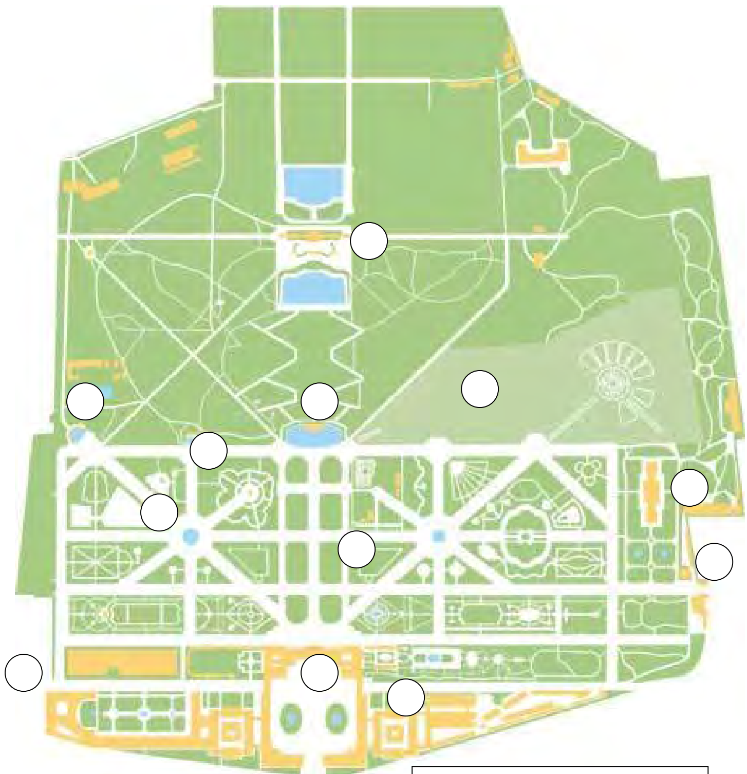
Orientierungsplan von www.schoenbrunn.at