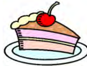
ein Stück Sahnetorte

Wie oft pro Woche solltest du folgende Speise oder Getränk zu dir nehmen?