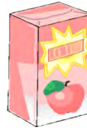
Apfelsaft mit Zucker